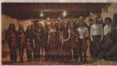
Um momento da programação da Semana da Música de Ouro Branco.

A Semana da Música de Ouro Branco acontece nesta 11ª edição com o festival "Semana da Música", que reuniu músicos vindos de diversos lugares na cidade mineira entre 8 e 15 de outubro.