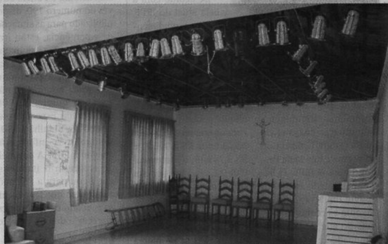
O salão de convivência do Asilo está sendo preparado para receber apresentações teatrais voltados para os internos e a população em geral.

Espaço do Ponto de Cultura do Lar do Idoso deve ser inaugurado em fevereiro