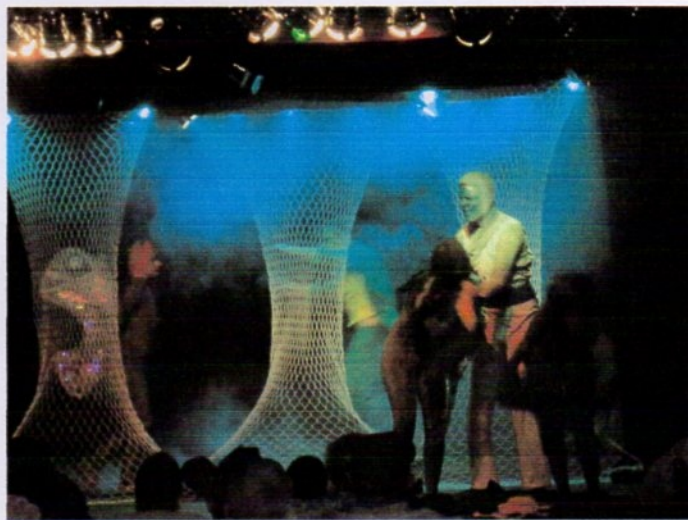
"O Jardim e as Coisas do Céu" na "Sala de Espetáculos Morel Mendonça Meireles" "Ponto de Cultura Casa do Idoso"