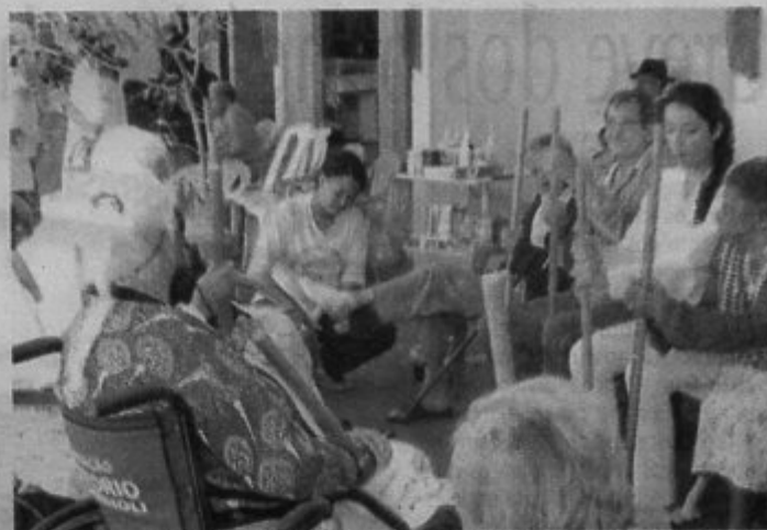
Uma das propostas da oficina literária é fazer com que os participantes escrevam as histórias dos internos, que devem ser transformadas em livro

A Fundação Frederico Ozanan inscreveu a entidade para a implantação do ponto de cultura no Lar dos Idosos com o intuito de garantir melhorias na qualidade de vida dos internos através de ativi-