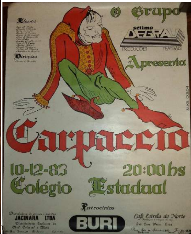
Produções Artísticas no mês de dezembro de 1983, no Colégio Estadual, em Barbacena