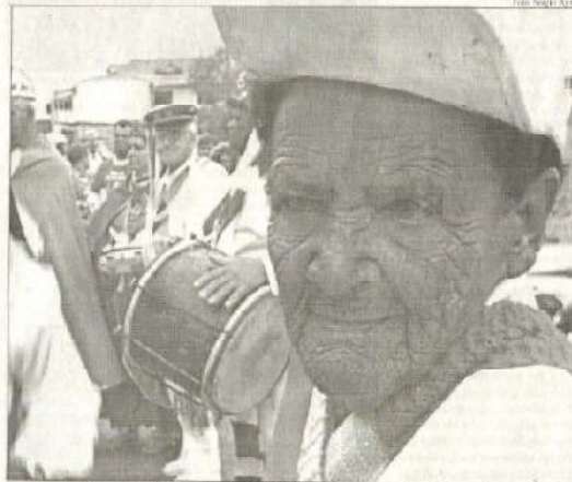
O congado da Festa de Santa Efigênia é uma das atrações da Jornada

"A jornada acontece desde 2009, sempre com o objetivo de incentivar os municípios mineiros para o desenvolvimento, em parceria com a comunidade, de atividades e ações relacionadas à preservação e divulgação do patrimônio cultural", explicou Edison Brindão, diretor de Cultura e Turismo da AGIR. Entre os dias 17 de agosto e 30 de setembro - e dentro do tema proposto - cada município ou cidade que confirmar sua adesão ao projeto terá a oportunidade de integrar a Jornada Mineira em seu calendário cultural, por meio das atividades promovidas. "As instituições parceiras deste ano, que vão engrossar nosso evento, são a Escola de Educação Patrimonial de Barbacena, o Conselho Municipal do Patrimônio Histórico e Artístico, a Associação Cultural Sétimo Degrau e a Associação dos Amigos dos Museus de Barbacena - AMBAR", concluiu.